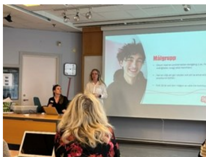
Presentation på Nynäshamns gymnasium och på Riksäpplet i Haninge.